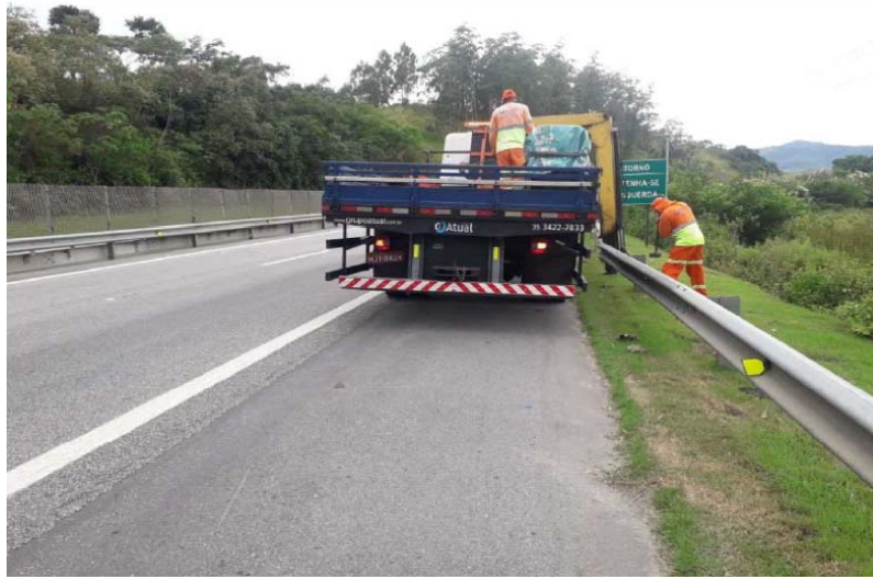
Foto 6 – Dispositivo de segurança / Defesa lateral – Km 06+900 Norte